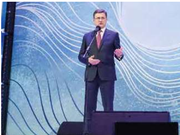
А. В. Новак Заместитель Председателя Правительства Российской Федерации