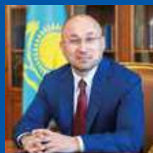
ДАУРЕН АСКЕРБЕКОВИЧ АБАЕВ

ЧРЕЗВЫЧАЙНЫЙ И ПОЛНОМОЧНЫЙ ПОСОЛ РЕСПУБЛИКИ КАЗАХСТАН В РОССИЙСКОЙ ФЕДЕРАЦИИ