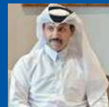
АХМЕД БЕН НАСЕР БЕН ДЖАСИМ АЛЬ ТАНИ

ЧРЕЗВЫЧАЙНЫЙ И ПОЛНОМОЧНЫЙ ПОСОЛ КАТАРА В РОССИИ